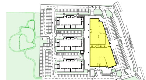
LOKALIZACJA MIESZKANIA W BUDYNKU